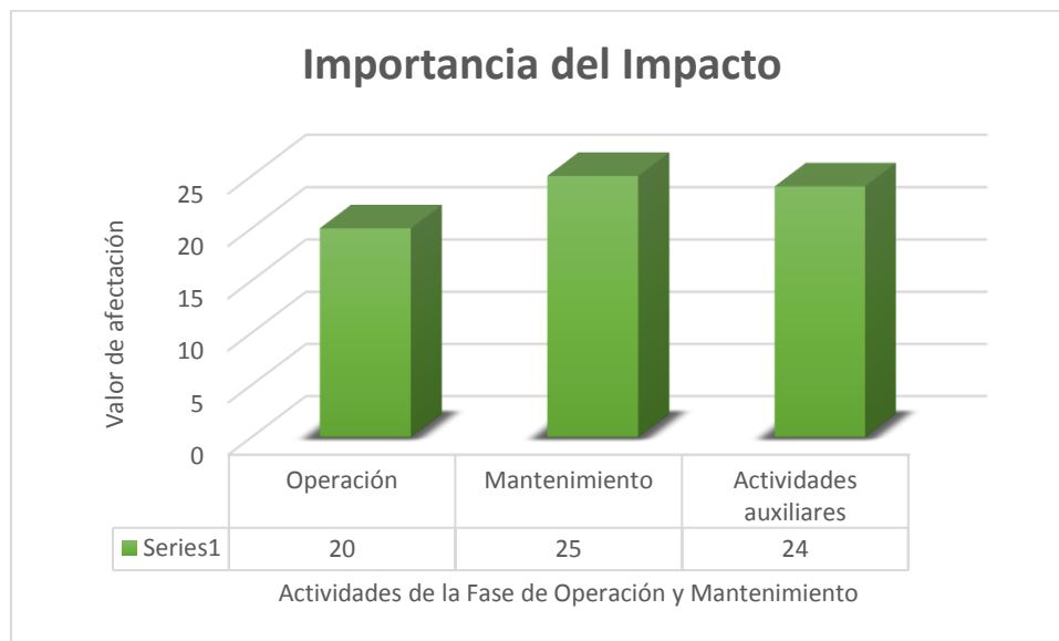
Gráfico 11-2. Impactos ambientales para la fase de operación y mantenimiento

Elaborado por: Ecosambito C. Ltda., 2016